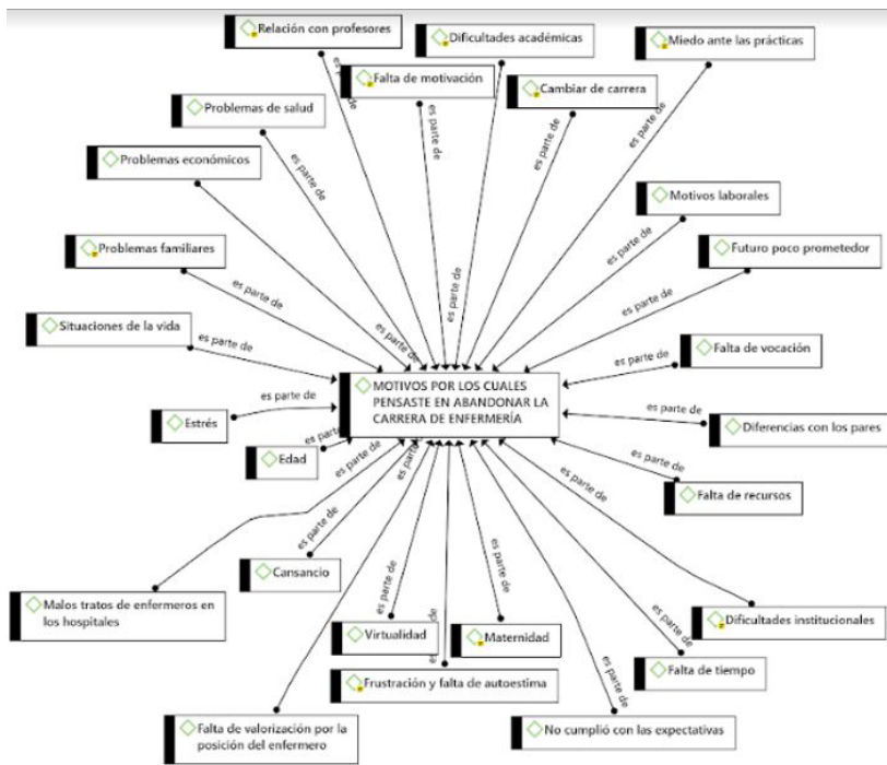
Imagen 2: motivos que generan querer abandonar la carrera de Enfermería por parte de los estudiantes.