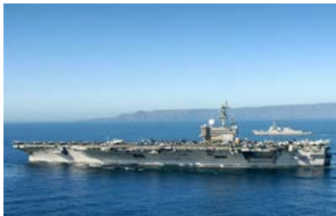
El ejercicio multidominio comenzó el 2 de agosto y se extenderá hasta el 27 de agosto.