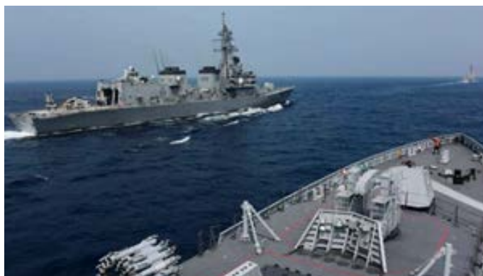
Fuerzas navales de India, Estados Unidos, Japón y Australia, el 3 de noviembre de 2020, frente a la India.