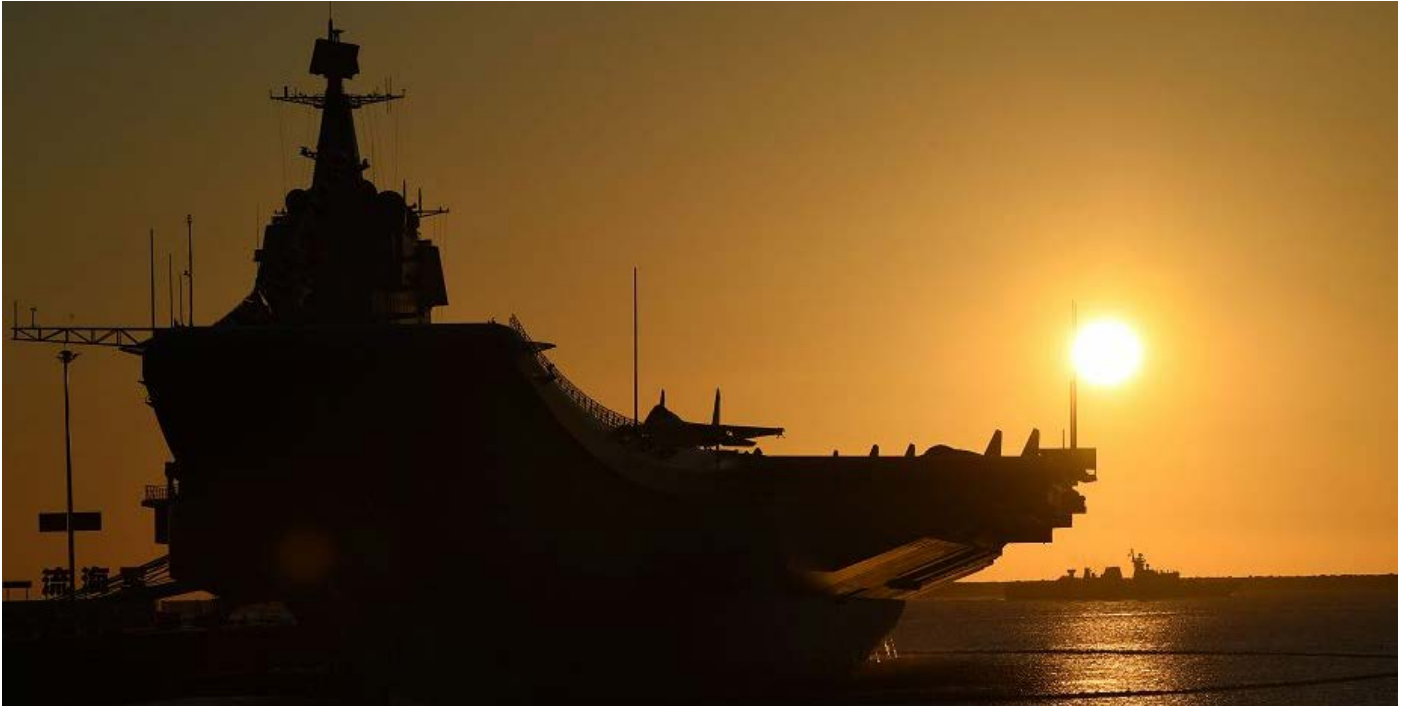
Portaaviones Shandong en un puerto naval de Sanya.

Con motivo de los festejos por el 94 aniversario de la creación del Ejército de Liberación Popular (EPL), el Ejército, la Armada y la Fuerza Aérea realizaron una demostración militar. La Armada (PLAN) publicó un video en su cuenta donde presentó algunos de sus grandes buques de guerra, entre los que se cuentan el portaaviones Liaoning, el portaaviones