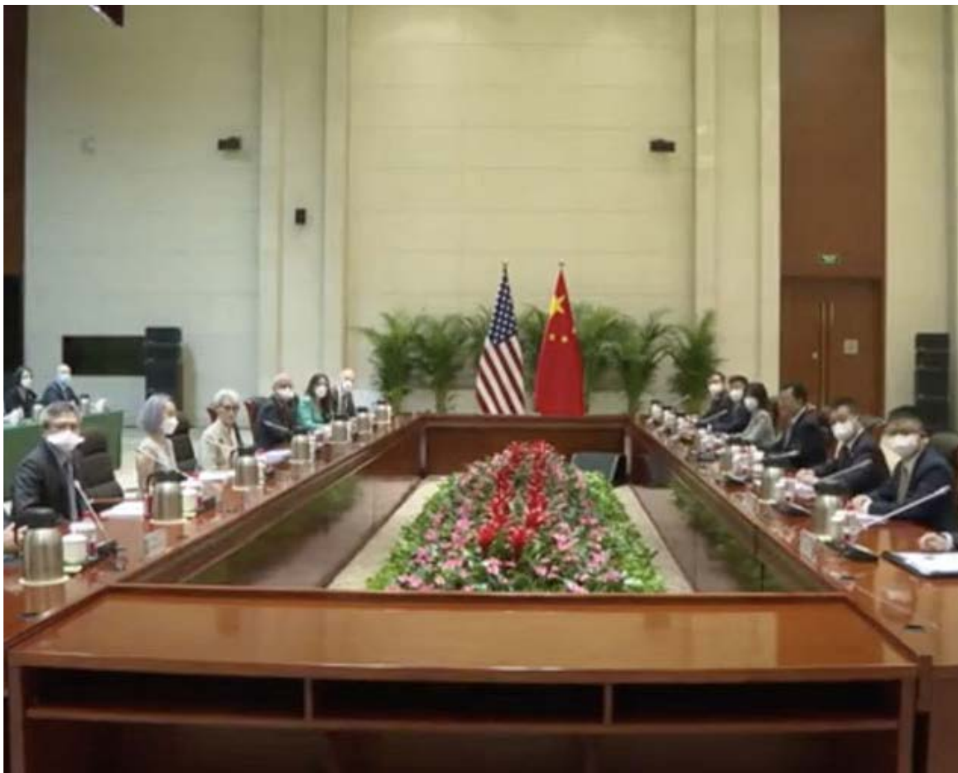
Viceministro de Relaciones Exteriores chino recibe la visita de la Vice Secretaria de Estado estadounidense -Tianjin 26 de julio de 2021

La relación entre China y Estados Unidos está estancada, fundamentalmente porque algunos estadounidenses describen a China como un "enemigo imaginario", dijo el lunes el viceministro de Relaciones Exteriores de China, Xie Feng, durante las conversaciones con la subsecretaria de Estado de Estados Unidos, Wendy Sherman, en el municipio de Tianjin de China.