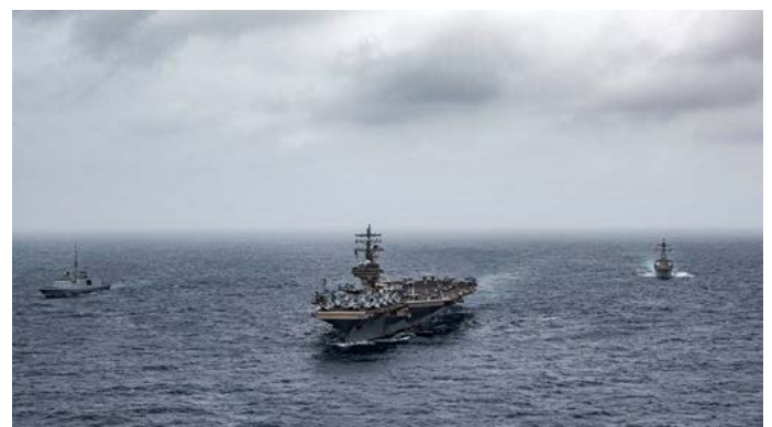
Fragata de la marina francesa FS Languedoc, el portaaviones USS Ronald Reagan y el destructor de misiles guiados USS Halsey, navegando en formación en el Mar Árabe.