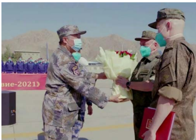
Comandante de las fuerzas chinas recibe a su homólogo de las Fuerzas Armadas de Rusia, 31 de Julio 2021