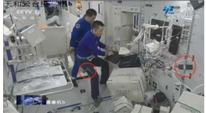
Astronautas chinos construyendo la estación espacial en la que se puede observar un teléfono celular Huawei.

Para finalizar y a modo de conclusión, la competencia tecnológica tiene implicancias geopolíticas en un mundo hiperconectado y donde la interdependencia es la matriz de las relaciones internacionales; la maniobra estratégica de los actores extra regionales con sus aliados tradicionales se trastoca con las políticas disruptivas Chinas.