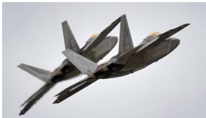
Dos F-22 Raptors de la Fuerza Aérea de EE. UU. Sobrevuelan Alaska en 2016

Los F-22 son aviones de combate de quinta generación, los aviones de combate más avanzados del mundo, que incorporan tecnologías furtivas y conectan sistemas de sensores a bordo con sistemas de información externos para brindar a sus pilotos una vista detallada del espacio de batalla. Los F-35 estadounidenses son otro ejemplo.