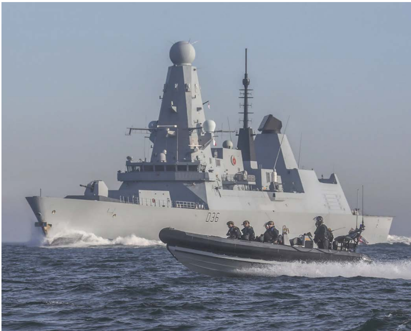
HMS "Defender" ingresa al Mar de China Meridional

El HMS "Defender", un destructor Tipo 45 de la Armada Real y que forma parte del Grupo de Ataque de Portaaviones del HMS "Queen Elizabeth" (CSG21) ingresó en el Mar de China Meridional. El CSG21 ha estado coordinando ejercicios con las armadas aliadas de India, Malasia y Singapur y tiene previsto atracar en cinco puertos japoneses el próximo mes de septiembre.