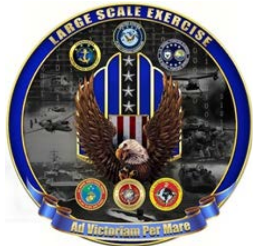
Large Scale Exercise 2021 logo

Finalmente cabe apreciar que esta ejercitación contribuiría a la puesta en marcha y perfeccionamiento de la "Nueva Arquitectura de Operaciones"