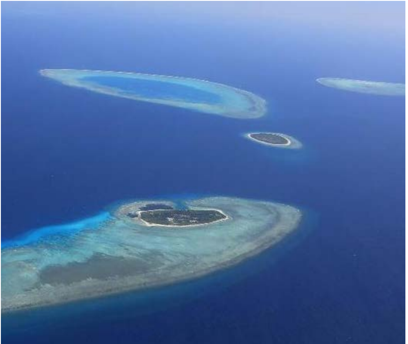
Vista de la isla Pattle, archipiélago Islas Xisha.

El portavoz del Comando del Teatro Sur, coronel Tian Junli, de la Fuerza Aérea, dijo que el 12 de julio, el destructor de misiles guiados USS "Benfold" ingresó en las aguas territoriales de las islas Xisha/Paracels sin la aprobación del gobierno chino.