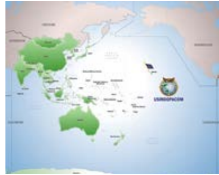
Patrullas de barcos navales chinos en el Golfo de Beibu el 24 de junio.

De acuerdo a información suministrada por el INDOPACOM se realizarán operaciones de entrenamiento para actividades de apoyo logístico, aterrizajes anfibios, operaciones aéreas, operaciones