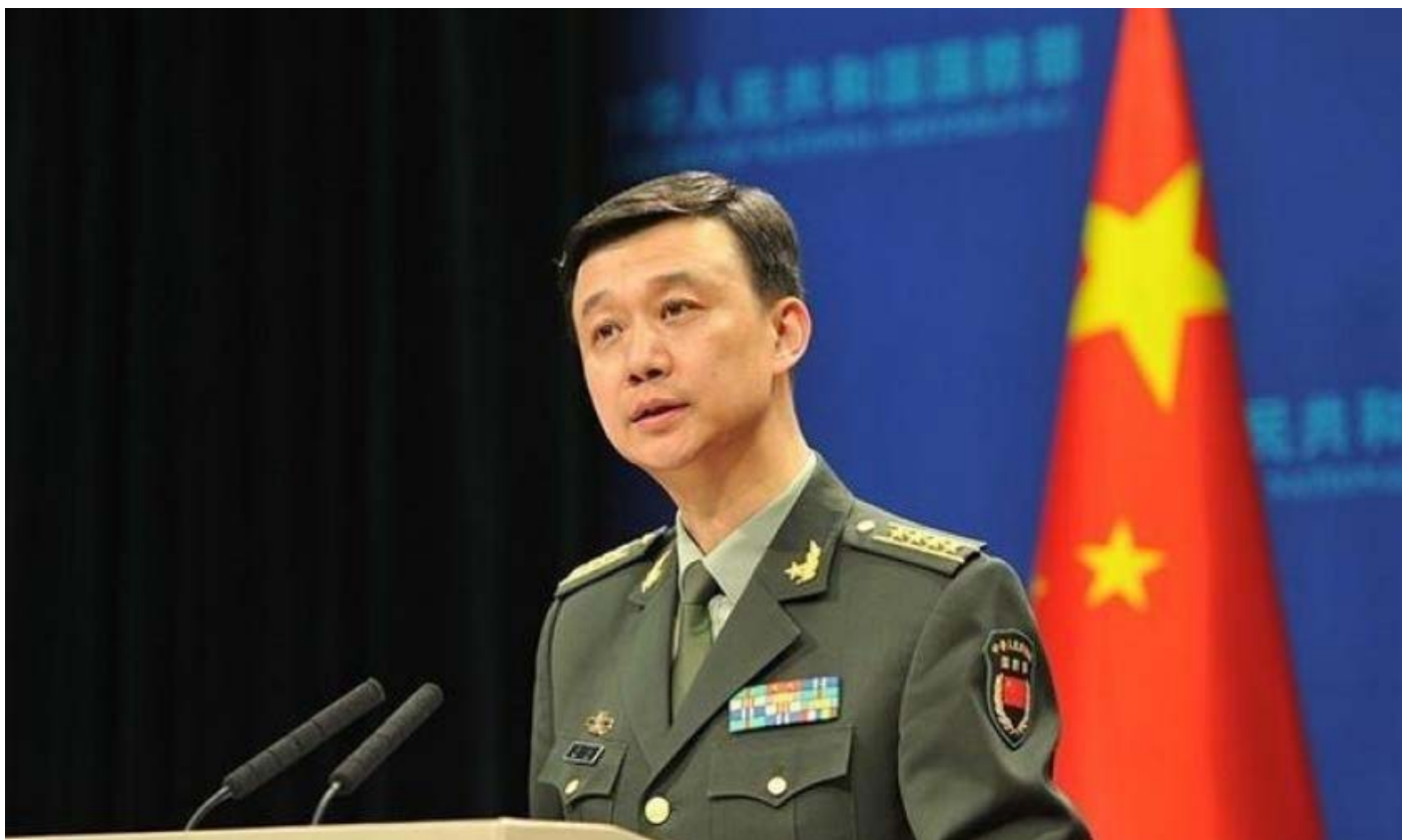
Portavoz del Ministerio de Defensa Nacional de China, Coronel Mayor Tan Kefe

El portavoz del Ministerio de Defensa Nacional de China, Coronel Mayor Tan Kefe declaró que: "El Libro Blanco de Defensa de Japón 2021 publicado el 13 de julio critica sin fundamento la defensa nacional y el desarrollo militar normales de China; especula maliciosamente sobre la política de defensa nacional; juzga deliberadamente a China (refiriéndose a ella como "la amenaza de China") e interfiere groseramente en los asuntos internos en lo que refiere a la cuestión de Taiwán.