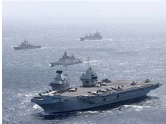
El CSG21 en un ejercicio de tres días con la Armada de India en la Bahía de Bengala.

Según lo informado por la página web del RUGB, las armadas de ambos se encuentran en medio de un renacimiento de la capacidad de portaaviones, con el CSG21 liderando la capacidad expedicionaria conjunta. El esfuerzo conjunto proporciona una seguridad tangible a nuestros amigos y una disuasión creíble para aquellos que buscan socavar la seguridad mundial. En reciprocidad, un buque de guerra indio también se ejercitará con la Royal Navy en el Atlántico durante el mes de agosto