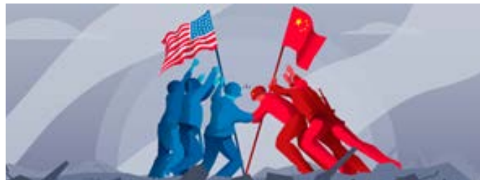
Estados Unidos y República Popular de China miden fuerzas

Debido principalmente a las diferencias en sus visiones del mundo, experiencias históricas y capacidades, China y los EE. UU. Tienen concepciones divergentes de la seguridad, lo que a su vez ha llevado a sus diferentes prácticas de seguridad. Los intereses de seguridad de China y Estados Unidos en Asia convergen y divergen, y a medida que Estados Unidos comience a contemplar a China como un adversario latente, tal divergencia se volverá aún más notoria. Si bien ambas partes continuarán persiguiendo sus propios intereses de seguridad en Asia, cada país también debe adaptarse al cambiante panorama político, económico y de seguridad en esta región. Para permitir una coexistencia