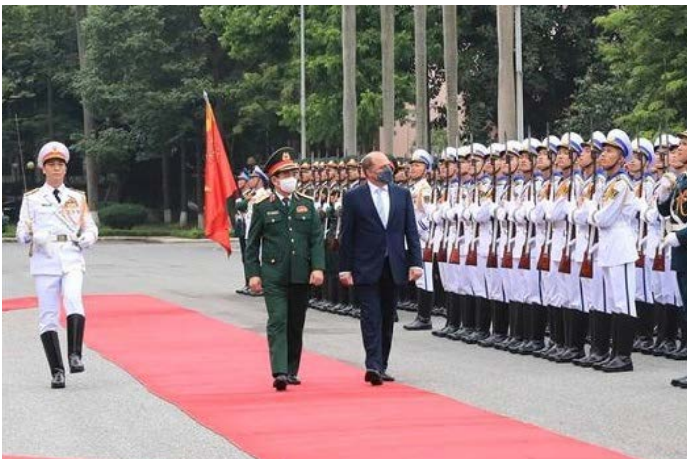
El ministro vietnamita de Defensa, Phan Van Giang, recibe al secretario de Estado para la Defensa del Reino Unido, Ben Lobban Wallace en visita oficial del 21 al 23 de julio 2021

La Embajada de China en Reino Unido expresó su profunda preocupación y firme oposición a las recientes declaraciones del secretario de Defensa británico Ben Wallace durante una visita a Vietnam sobre la situación en el Mar de China Meridional, ya que ignoran los hechos y socavan la paz y la estabilidad regionales.