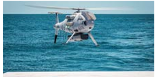
Schiebel CAMCOPTER S-100 completa con éxito las prueba con éxito UAS

En una demostración combinada patrocinada por la Oficina de Investigación Naval de EE. UU. (NRO) en un buque comercial frente a la costa de Pensacola, Florida, Schiebel y Areté demostraron el CAMCOPTER® S-100 y sus capacidades. El sistema aéreo no tripulado (UAS) CAMCOPTER® S-100 de Schiebel es una capacidad probada operativamente para aplicaciones militares y civiles. El UAS de despegue y aterrizaje vertical (VTOL) no requiere un área preparada o equipo de apoyo para permitir el lanzamiento y la recuperación. Opera de día y de noche, en condiciones climáticas adversas, con una capacidad de visión más allá de los 200 km / 108 nm, por tierra y mar.