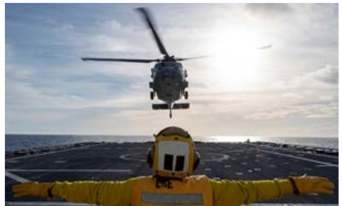
USS Charleston (LCS18) operando para la 7Flota, agosto 2021

En 1918, el Presidente Woodrow Wilson declaró que la defensa de "una total y absoluta libertad de navegación de los mares" era uno de los principios por los cuales Estados Unidos y otras naciones se habían embarcado en la Primera Guerra Mundial y en los mismos términos, durante la Segunda Guerra Mundial, el Presidente Franklin D. Roosevelt declaró que mantener la libertad de los mares era un "deber" de la clase política americana.