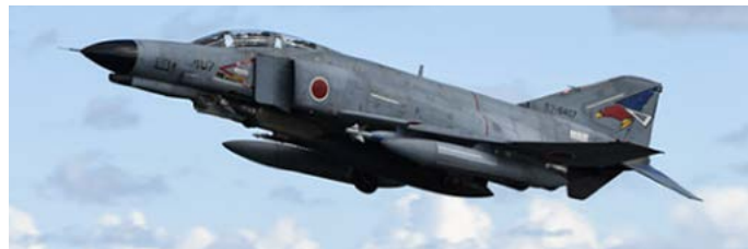
Fuerza Aérea de Autodefensa de Japón realiza ejercicio de entrenamiento bilateral conjunto con la Fuerza Aérea de EE.UU., en Japón, 1 de noviembre de 2018.

https://www.flickr.com/photos/us7thfleet/45017091214/