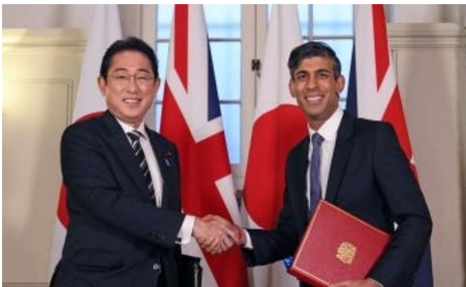
Firma del Acuerdo de Acceso Recíproco Japón-Reino Unido

El Primer Ministro del Reino Unido de Gran Bretaña e Irlanda del Norte, Rishi Sunak y el Primer Ministro de Japón, KISHIDA Fumio de visita en el Reino Unido, firmaron un acuerdo relativo a la facilitación del acceso recíproco y cooperación entre las Fuerzas de Autodefensa de Japón y las Fuerzas Armadas del Reino Unido de Gran Bretaña e Irlanda del Norte (“Acuerdo de Acceso Recíproco Japón-Reino Unido” o “RAA Japón-Reino Unido”).