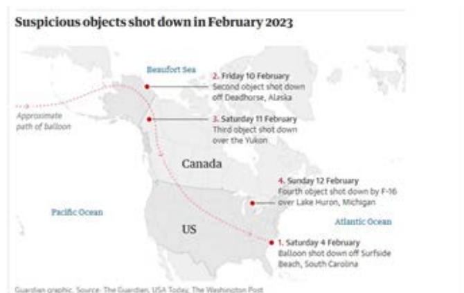
Ubicación y fecha de los objetos derribados en febrero 2023

El pasado 4 de febrero pasado, en proximidades de la costa del Estado de Carolina del Sur, EE.UU, la Fuerza Aérea de ese país derribó un objeto volador sospechoso. El suceso se repitió tres veces en una semana, en el norte de Alaska (10 de febrero), noroeste de Canadá (11 de febrero) y Michigan, noreste de los EE.UU (12 de febrero). En el caso del derribo sobre espacio aéreo canadiense, la aeronave actuó bajo la supervisión del NORAD 1 , un comando combinado entre los EE.UU y Canadá, con sede en el estado de Colorado, que coordina la defensa aérea en el área de América del Norte. Las fechas y lugares de los encuentros se observan en el gráfico siguiente.