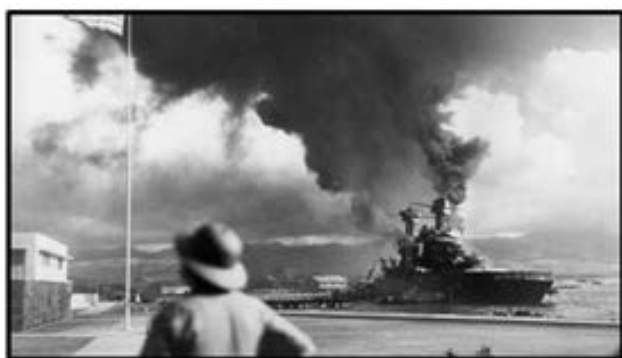
Foto: Ataque a Pearl Harbor.