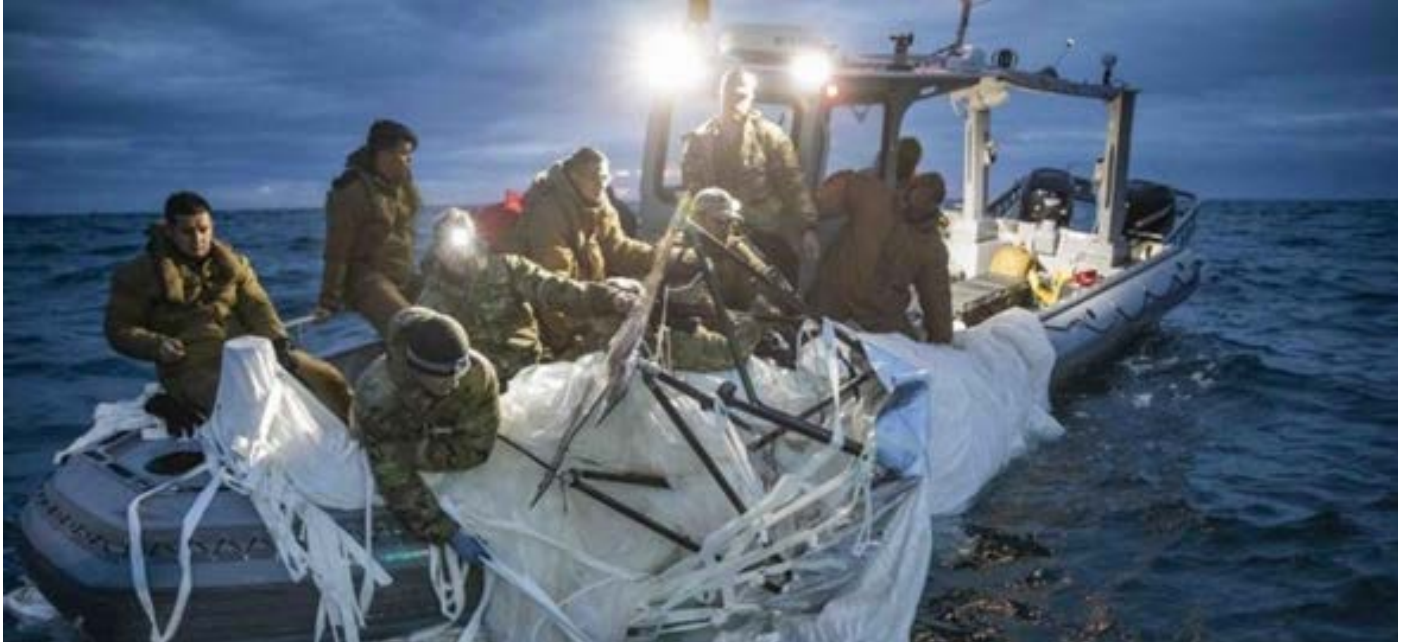
Buques y buzos estadounidenses siguen buscando restos del globo frente a la costa de Carolina del Sur

Un supuesto globo de vigilancia chino que Estados Unidos derribó la semana pasada era capaz de interceptar señales de comunicaciones, según ha declarado un funcionario estadounidense. El globo estaba equipado con múltiples antenas capaces de realizar "operaciones de recopilación de inteligencia", declaró un alto funcionario del Departamento de Estado en una rueda de prensa. El jueves, los legisladores esta-