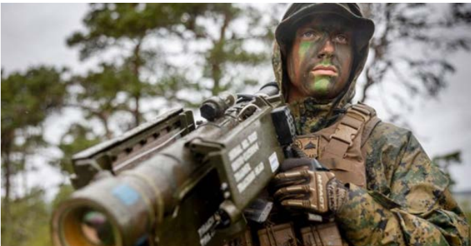
Un marine de EE.UU. practica con un cañón antiaéreo robotizado de última generación en septiembre de 2022

En un documento denominado "Force Design 2030", las autoridades de la Infantería de Marina (Marine Corps, una fuerza independiente de la Armada de los EE.UU) plantean una reorganización organizacional y operativa, basada en mas cantidad de unidades operativas, de menor tamaño que las actuales, y con potente y preciso armamento, para operar en cadenas insulares en el Indo-Pacífico ante un potencial conflicto con China. La reorganización se basa en parte en la experiencia obtenida recientemente en Ucrania, y ha generado gran resistencia entre muchos ex-marines, que la consideran inadecuada.