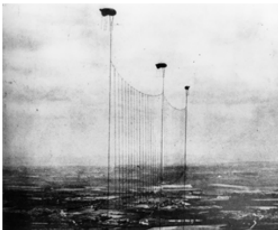
Filas de aerostatos y dispositivos asociados utilizados por la defensa aérea de Londres contra los bombardeos alemanes durante la Segunda Guerra Mundial

También en la Segunda Guerra Mundial el Imperio del Japón experimentó con el uso de estos dispositivos, lanzándolos a través del Océano Pacífico (se estima en 9.000 el número de globos enviados) para que exploten al caer sobre suelo estadounidense. Según la información disponible, como resultado se produjeron solo seis víctimas, en Dakota del Norte 3 .