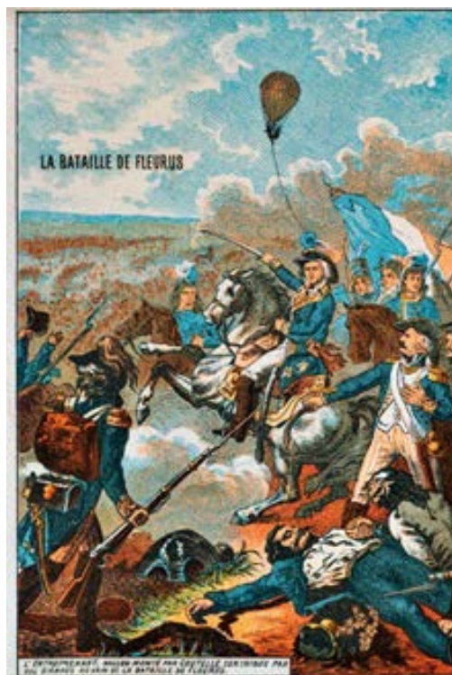
El globo “Entrepreneur”, pilotado por Coutelle, en la batalla de Fleurus, 1794 (Imagen de los 1890s).

La primera vez que se utilizaron aerostatos (o aerostatos) 2 -tal su correcta denominación- con fines militares fue en el año 1794, en Fleurus (actual Bélgica) por idea del ingeniero francés Jean-Marie-Joseph Coutelle (fundador del Cuerpo Aerostático Francés). Su objetivo, cumplido, fue la observación de la disposición del enemigo austro-holandés que lo enfrentaba. Coutelle se valió de un globo, bautizado “Entrepreneur”, para elevarse por sobre el campo de batalla y desde la altura informar las posiciones austríacas. Como método para transmitir la información utilizó el lanzamiento de mensajes en los cuales detallaba la disposición de sus enemigos, de quienes tuvo que soportar el intento de neutralizarlo con un asedio que fue infructuoso.