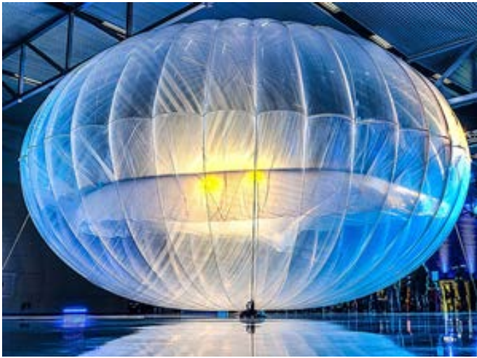
Globo Google Project Loon 5

Para finalizar con estos ejemplos, recientemente salió publicado en Twitter 6 que Fuerza Aérea de Ucrania, ha detectado que el Ejército ruso está utilizando globos con reflectores para generar falsos ecos de radar y así saturar las defensas aéreas de Ucrania.