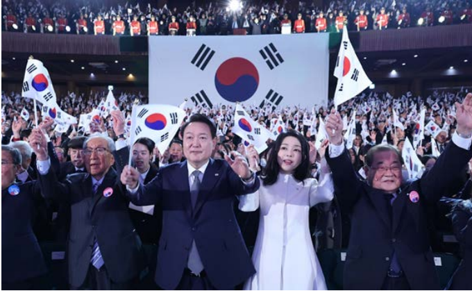
El presidente Yoon Suk-yeol y la Primera Dama Kim Keon-Hee en la ceremonia conmemorativa del aniversario del Movimiento Independentista, Yu Gwan-sun Hall, Seúl

En un acto realizado en Seúl para conmemorar el 104° aniversario del Movimiento Independentista del 1° de marzo, el presidente de la República de Corea, Yoon Suk-yeol, describió el cambio de condición de Japón, al cual reconoció pasar de “agresor militarista” en el pasado a “socio con el cual se comparten valores universales” en el presente y de cara al futuro. El discurso del presidente Yoon está en línea con una política de acercamiento a Japón y alineamiento junto a ese país y los EE.UU para contrarrestar la amenaza de Corea del Norte. Yoon no mencionó las diferencias históricas que separan a su país del Japón, principalmente las referidas a sometimientos de los cuales fue objeto la población coreana durante la ocupación japonesa.