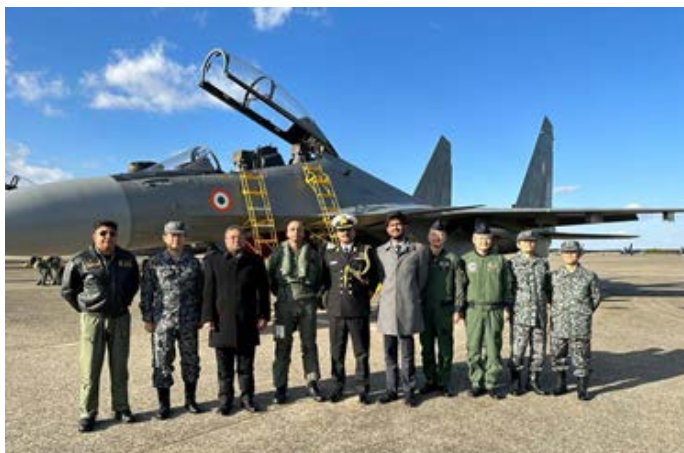
Los primeros cazabombarderos Sukhoi Su-30MKI aterrizaron en tierras japonesas.

Del 16 al 26 de enero en Japón la Fuerza Aérea de Autodefensa de Japón (JASDF) y la Fuerza Aérea India (IAF) realizaron por primera vez en la historia un ejercicio combinado. Se trata del Veer Guardian 2023.