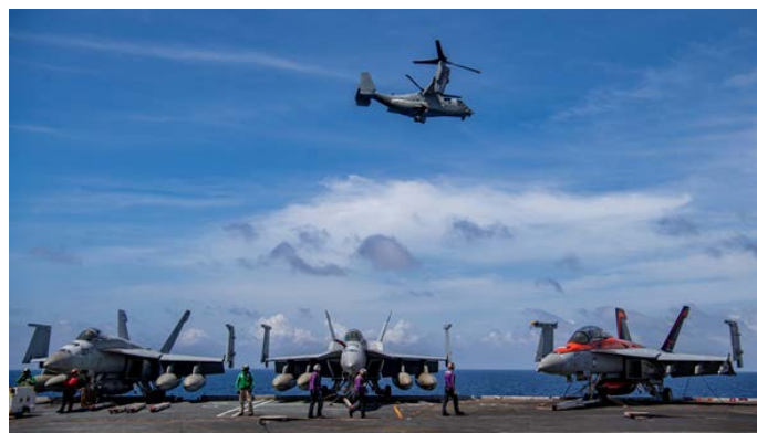
Elementos del Grupo de ataque del USS Nimitz operando junto a la Infantería de Marina de los EE.UU en el Mar del Sur de la China - Febrero 2023

Link: https://www.cpf.navy.mil/Newsroom/News/Article/3296599/nimitz-carrier-strike-group-and-makin-island-amphibious-ready-group-conduct-com/