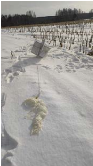
Fotografía de los reflectores utilizados como contramedidas electrónicas.

Para finalizar con estos ejemplos, recientemente salió publicado en Twitter 6 que Fuerza Aérea de Ucrania, ha detectado que el Ejército ruso está utilizando globos con reflectores para generar falsos ecos de radar y así saturar las defensas aéreas de Ucrania.