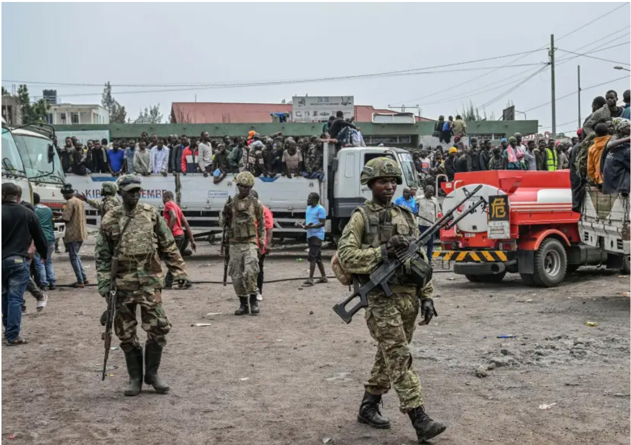
(Archivo) Rebeldes del M23 escoltan a soldados y policías del gobierno que se rindieron en un lugar no revelado en Goma, República Democrática del Congo, el jueves 30 de enero de 2025.

El compromiso de suscribir un acuerdo definitivo antes del 18 de agosto de 2025 fracasó entre acusaciones mutuas, aunque en octubre de ese año las partes acordaron la creación de un organismo de supervisión del cese al fuego (Chicago Tribune, 2025). El 15 de noviembre de 2025, el M23, la RDC y Ruanda rubricaron en Doha un acuerdo marco que definió ocho protocolos y un cronograma para futuras discusiones, sin producir efectos inmediatos sobre el terreno (Boston Herald, 2025; El Demócrata, 2025). En febrero 2026, ambas partes firmaron un acuerdo para que la MONUSCO, junto con la Conferencia Internacional sobre la Región de los Grandes Lagos (CIRGL), envíen del 23 al 27 de febrero de 2026, una misión exploratoria y preliminar conjunta en la localidad de Uvira, para supervisar el alto el fuego, una vez establecidos los canales de comunicación necesarios para facilitar el trabajo de la misión de conformidad con el mecanismo. (Infobae. 2026; Agencia EFE. 2026).